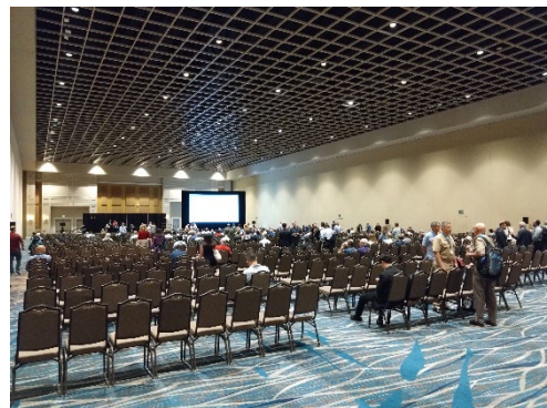
写真1 メイン会場の様子

本会議は、世界各国の放射線防護の専門家との意見交換や人的ネットワークの形成などを行うことができる非常に貴重な場であると感じた。また、放射性廃棄物に関するセッションもあり、バックエンド分野の研究者にとっても参加する意義の大きいものであると感じた。なお、今回は2028年にスペイン・バレンシアにて開催される予定である。放射線防護分野に関心のある方はぜひ参加を検討されたい。