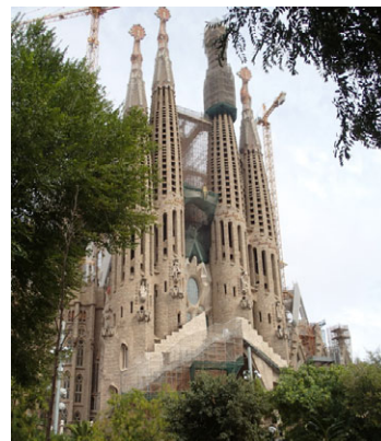
サグラダファミリア

今回の MRS2013 参加は海外の専門家からの意見を賜ることができ、大きな収穫があった。